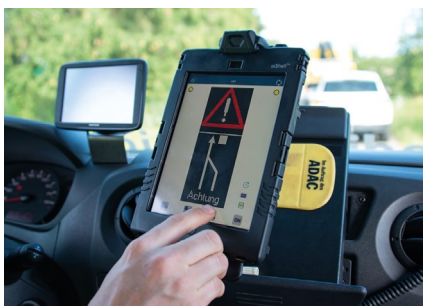
Steuerung durch Tablet Fernbedienung