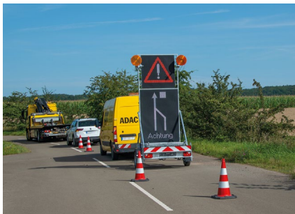
Die VWA-LED+ im Einsatz bei Absicherungsfirmen