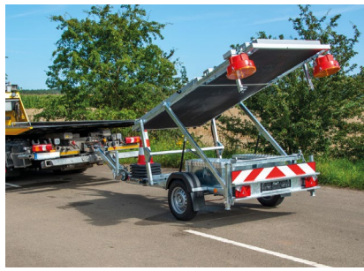
Aufrichtung ohne Fahrunterbrechung